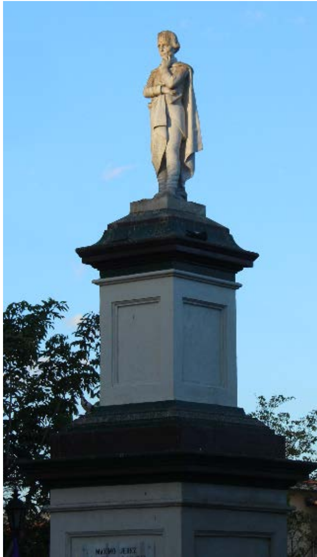
Figura 8. Francisco Durini, Monumento a Máximo Jerez (1883), mármol y piedra, León, Nicaragua.